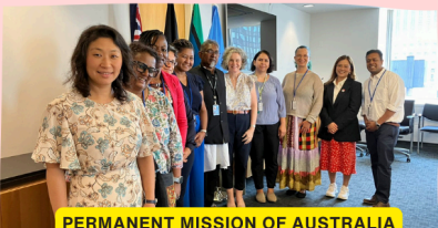
PERMANENT MISSION OF AUSTRALIA