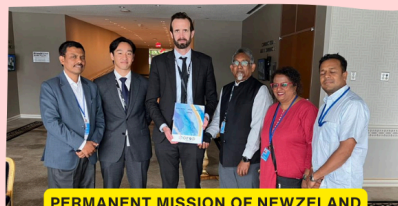
PERMANENT MISSION OF NEWZELAND