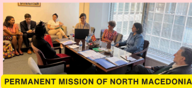
PERMANENT MISSION OF NORTH MACEDONIA