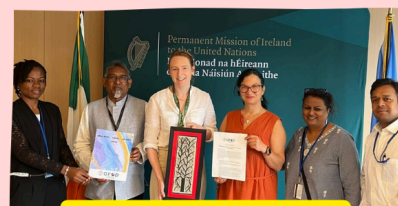
PERMANENT MISSION OF IRELAND