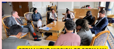
PERMANENT MISSION OF GERMANY