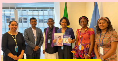
PERMANENT MISSION OF BRAZIL