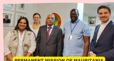
PERMANENT MISSION OF MAURITANIA