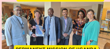
PERMANENT MISSION OF UGANDA