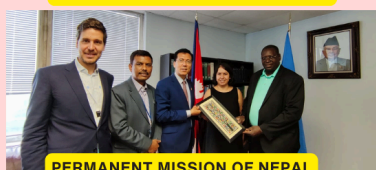
PERMANENT MISSION OF NEPAL